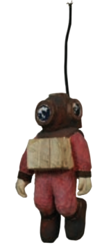
Unter falschen Freunden; 2010 Holz, Stahl, Farbe, 75 x 24 x 28 cm