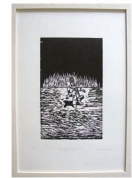
Annäherungsversuch; 2010 Holzdruck (Auflage, 12 + E.A.s) 50 x 35 cm exklusiv für Originale-Mitglieder