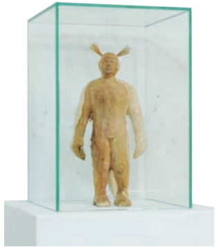
Da steckste nicht drin; 2010 Holz, 25 x 18 x 18 cm