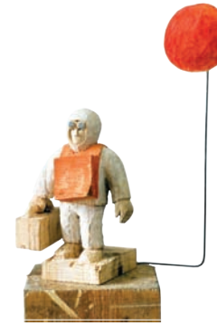
Herdplatte angelassen; 2009 Holz, Stahl, Farbe, 60 x 50 x 30 cm