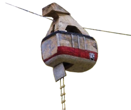
Fahrt ins Glück; 2008 Holz, Farbe, Stahlsseil, 60 x 30 x 50 cm