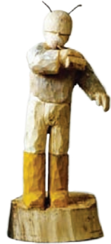
Annäherungsversuch; 2008 Holz, Farbe, 35 x 20 x 19 cm