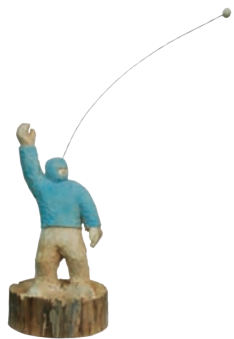
Schön gedacht!; 2010 Holz, Farbe, Stahl, 75 x 60 x 22 cm