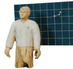
Aggregatzustände des Glücks - Nr. 372; 2010 Holz, Farbe, 34 x 40 x 24 cm