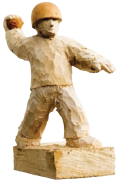
Irgendwas war; 2009 Holz, Farbe, 35 x 20 x 30 cm