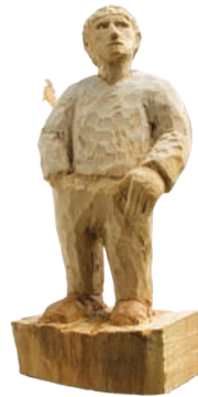
Holz, Farbe, 35 x 20 x 20 cm