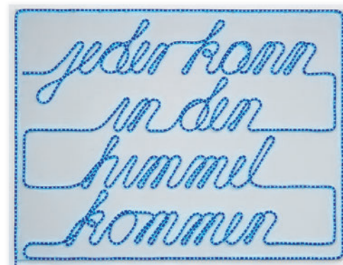
Jeder kann in den Himmel kommen, 2008 Gabun, Lichtschlauch blau, Acryllack, je 1/3, 221 x 168 x 10 cm, 4.800 Euro