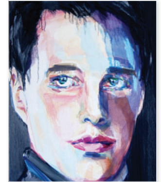
Unsere Besten – Franz M.; 2006 Öl auf Leinwand, 100 x 80 cm 3.100 Euro