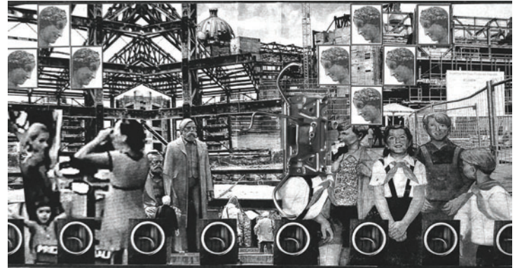
Et in actis ego: Selektive Rekonstruktion

Studien der Architektur und Pädagogik, Professur für Kunstpädagogik in Karlsruhe.