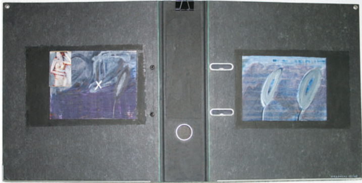
Akte X, I

Studium an der Kunstakademie Gdansk, danach Assistent dieser Akademie, Stipendium der Republik Polen, Willibald-Kramm-Preis Heidelberg