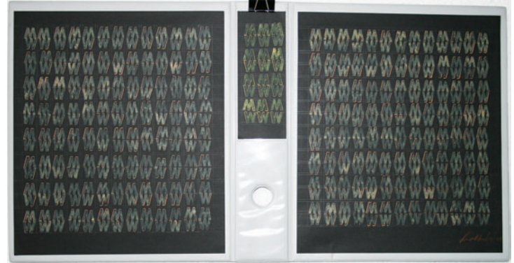
In Ordnung II

Studium an der Kunstakademie und an der Universität Karlsruhe.