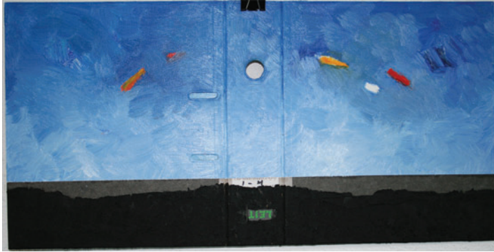
I - M

Studium an der Kunstakademie Karlsruhe und an der Universität Heidelberg (Psychologie/Pädagogik)