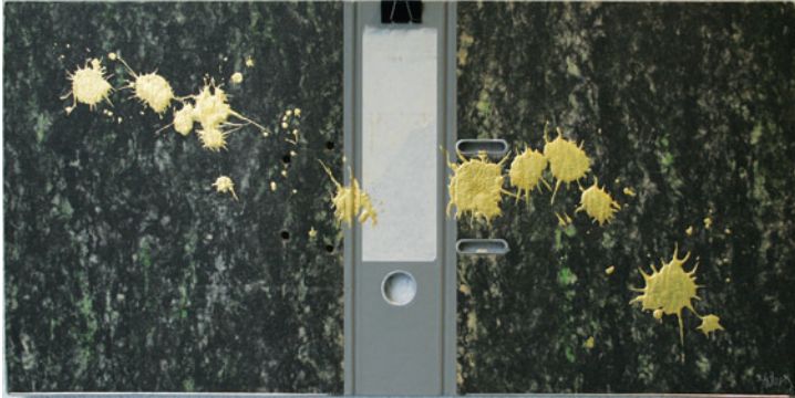
Goldener Regen #1

Studium an der FHS Schwäbisch-Gemünd, danach in Amsterdam und Zürich; Ausstattungsassistentin am Staatsschauspiel in Dresden, Theater Graz und Heidelberg